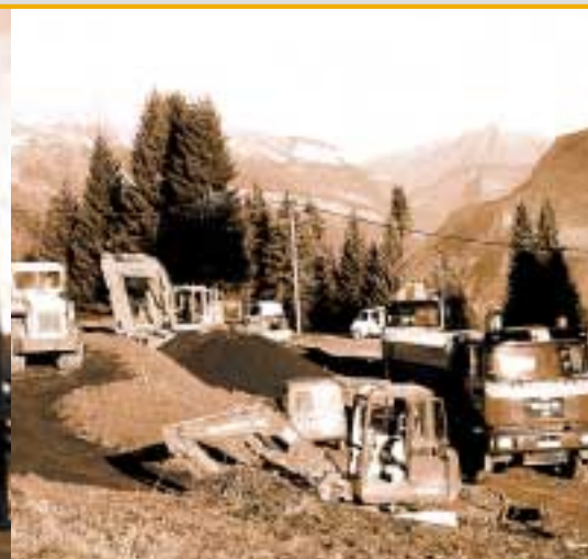
Le parking Bettex en cours de réalisation.