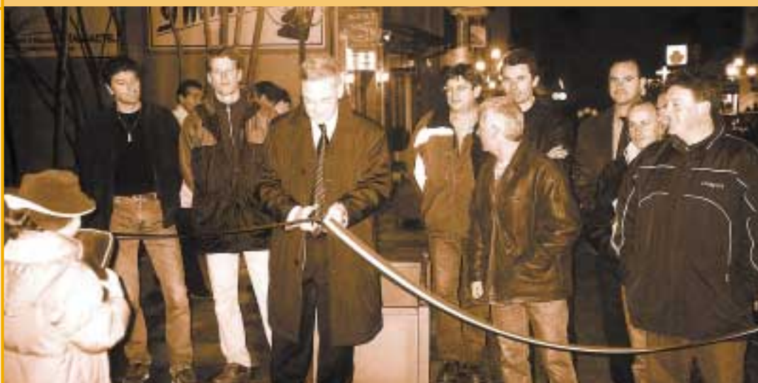
Le centre ville change de visage. Aux travaux de la Municipalité s'ajoutent des chantiers privés, contribuant eux aussi à la transformation du bourg.

La salle des mariages et la salle de réunion du bureau d'Etat civil du Fayet ont été entièrement rénovées et dotées d'un nouveau mobilier. C'est dans ce nouveau décor que le Conseil Municipal s'y est tenu le 21 novembre.